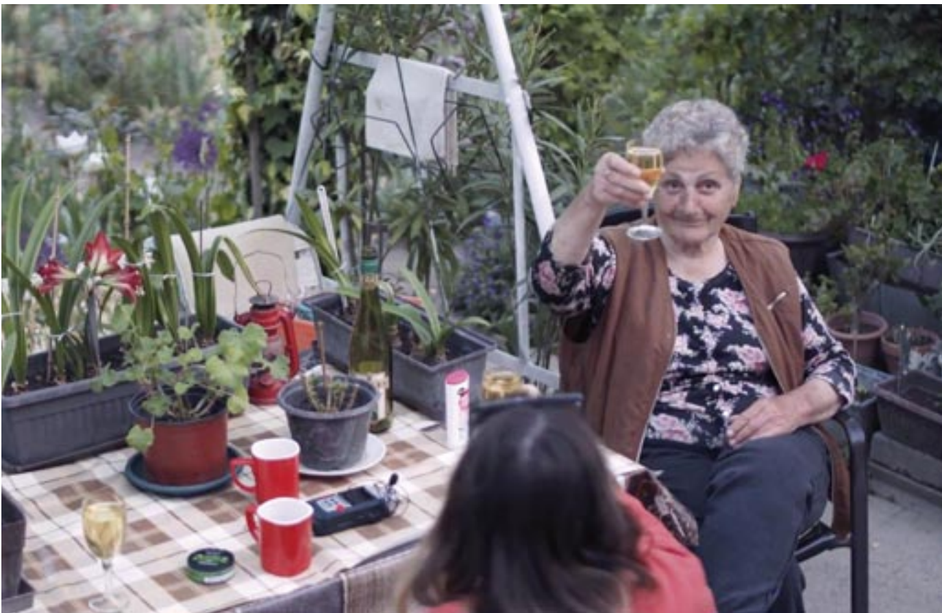
Stillbild från Maja Dahlström Horvaths film Esztimama

FILMPROGRAM AV STUDERANDE PÅ FALKENBERGS KONSTSKOLA - DISTANSUTBILDNING, KG I